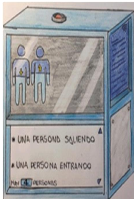
Ilustración 2: Number Support Fire