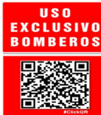
Ilustración 3. Código QR de lectura para la app de los bomberos