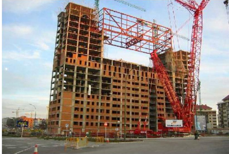
Ilustración 1. Actuales medidas de seguridad contra incendios en edificios