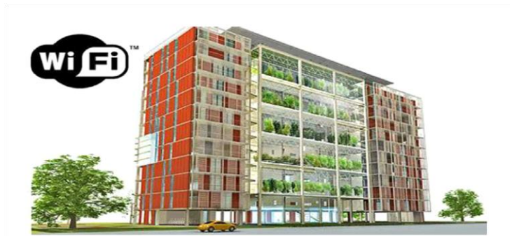
Ilustración 1: Edificio conectado por wi-fi

Se propone la aplicación de este invento, en base al estudio y observación y aplicación de la tecnología Wi-Fi para la comunicación de datos entre equipos situados dentro de una misma área (interior o exterior) de cobertura.