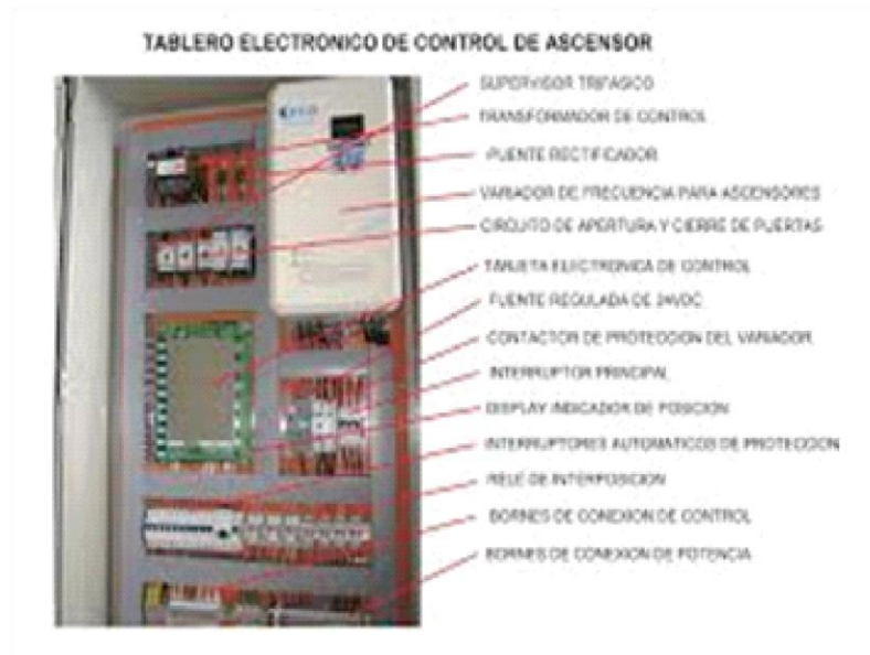
Ilustración 2: Partes del Number Support Fire

Si por una de esas la información no ha llegado bien, fuera del edificio, en un lugar donde haya probabilidad que no llegue el incendio, habrá un código QR con el que los bomberos podrán acceder a la información del number support fire sin necesidad de acceder al interior del edificio y ver las personas en apuro.